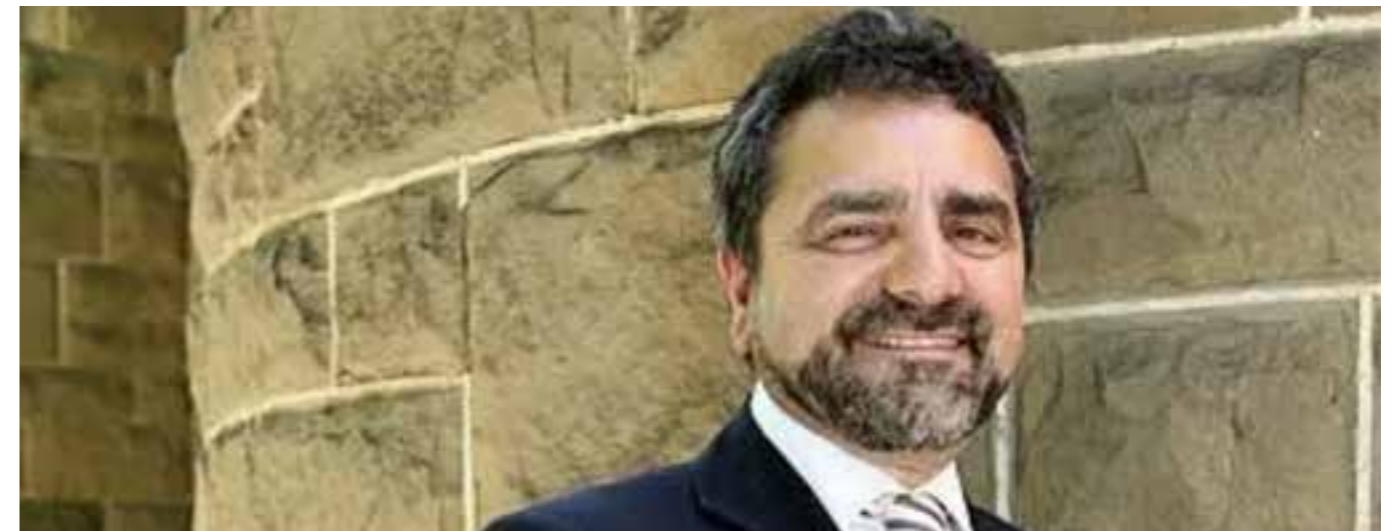
Joseph Lo Bianco

El jurat del Premi Internacional Ramon Llull va atorgar aquesta distinció al lingüista australià Joseph Lo Bianco per promoure el multilingüisme i trobar l'equilibri entre les llengües locals i les llengües oficials, i pel seu coneixement, interès i compromís amb la cultura i la societat catalana.